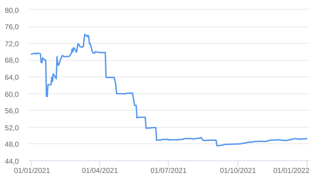
Patrimônio Líquido (R$ Milhões) - 31/12/2020 a 31/12/2021 (diária)