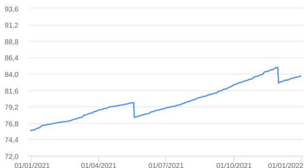
Patrimônio Líquido (R$ Milhões) - 30/12/2020 a 30/12/2021 (diária)