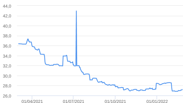
Patrimônio Líquido (R$ Milhões) - 02/03/2021 a 25/02/2022 (diária)