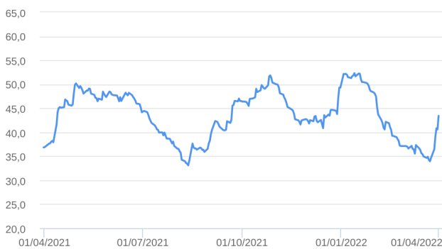
Patrimônio Líquido (R$ Milhões) - 31/03/2021 a 01/04/2022 (diária)