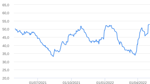
Patrimônio Líquido (R$ Milhões) - 30/04/2021 a 02/05/2022 (diária)