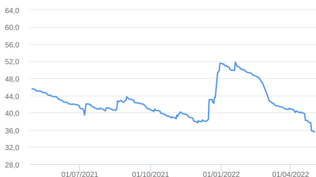
Patrimônio Líquido (R$ Milhões) - 30/04/2021 a 02/05/2022 (diária)