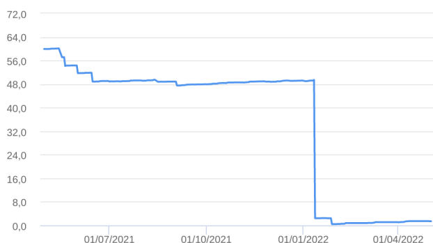
Patrimônio Líquido (R$ Milhões) - 30/04/2021 a 02/05/2022 (diária)