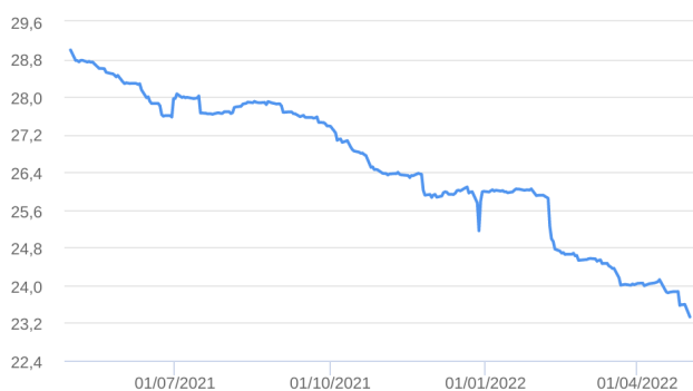
Patrimônio Líquido (R$ Milhões) - 30/04/2021 a 02/05/2022 (diária)