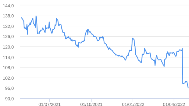
Patrimônio Líquido (R$ Milhões) - 30/04/2021 a 02/05/2022 (diária)