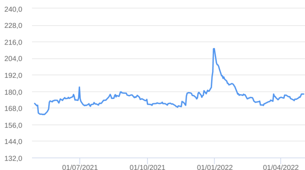
Patrimônio Líquido (R$ Milhões) - 30/04/2021 a 02/05/2022 (diária)