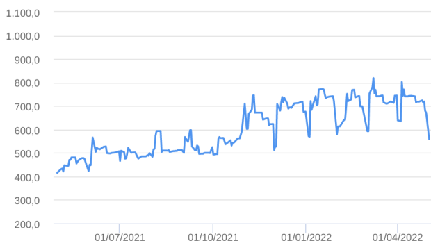
Patrimônio Líquido (R$ Milhões) - 30/04/2021 a 02/05/2022 (diária)