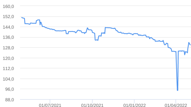
Patrimônio Líquido (R$ Milhões) - 30/04/2021 a 02/05/2022 (diária)