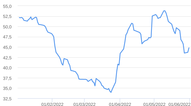
Patrimônio Líquido (R$ Milhões) - 03/01/2022 a 31/05/2022 (diária)