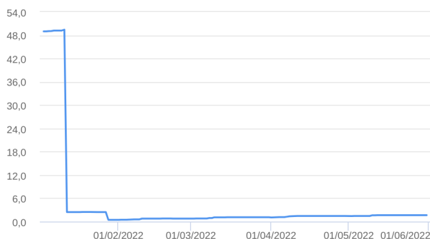
Patrimônio Líquido (R$ Milhões) - 03/01/2022 a 31/05/2022 (diária)