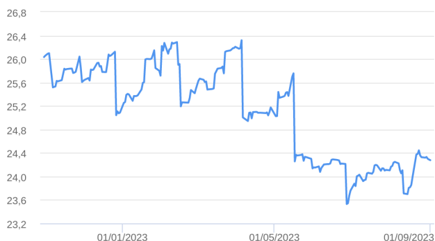
Patrimônio Líquido (R$ Milhões) - 31/10/2022 a 01/09/2023 (diária)