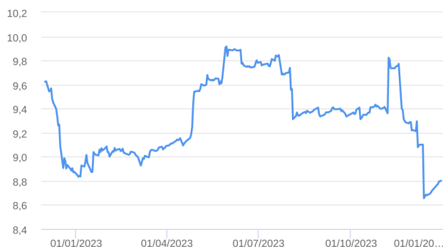
Patrimônio Líquido (R$ Milhões) - 01/12/2022 a 29/12/2023 (diária)