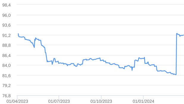
Patrimônio Líquido (R$ Milhões) - 01/04/2023 a 28/03/2024 (diária)