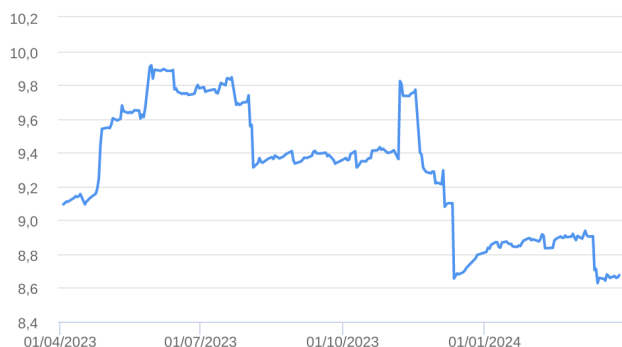
Patrimônio Líquido (R$ Milhões) - 01/04/2023 a 28/03/2024 (diária)