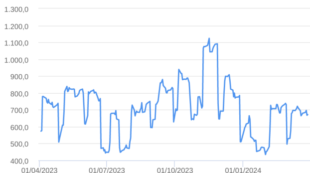
Patrimônio Líquido (R$ Milhões) - 01/04/2023 a 28/03/2024 (diária)