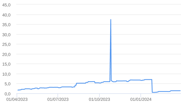
Patrimônio Líquido (R$ Milhões) - 01/04/2023 a 28/03/2024 (diária)