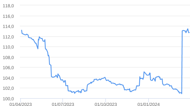
Patrimônio Líquido (R$ Milhões) - 01/04/2023 a 28/03/2024 (diária)