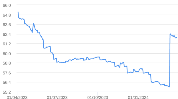
Patrimônio Líquido (R$ Milhões) - 01/04/2023 a 28/03/2024 (diária)