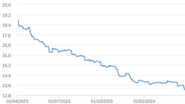
Patrimônio Líquido (R$ Milhões) - 01/04/2023 a 28/03/2024 (diária)