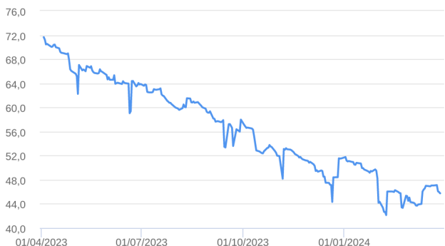
Patrimônio Líquido (R$ Milhões) - 01/04/2023 a 28/03/2024 (diária)