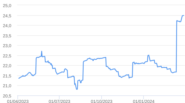
Patrimônio Líquido (R$ Milhões) - 01/04/2023 a 28/03/2024 (diária)