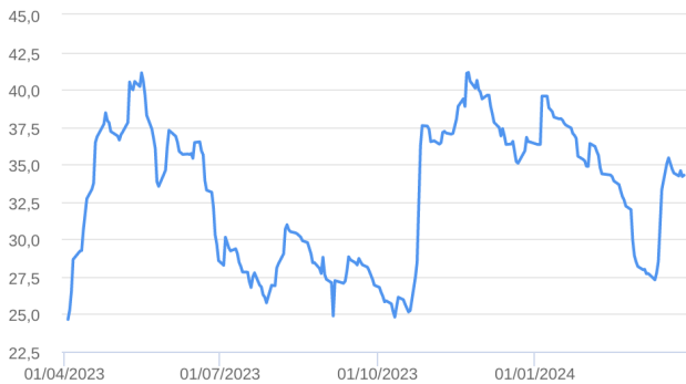
Patrimônio Líquido (R$ Milhões) - 01/04/2023 a 28/03/2024 (diária)