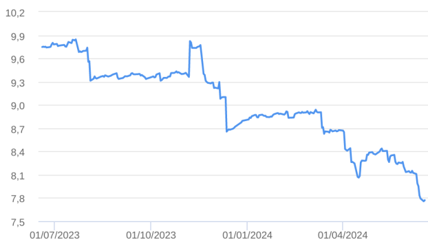
Patrimônio Líquido (R$ Milhões) - 19/06/2023 a 18/06/2024 (diária)