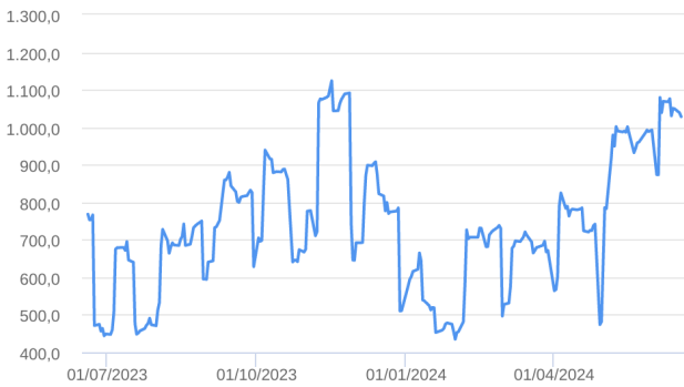
Patrimônio Líquido (R$ Milhões) - 19/06/2023 a 18/06/2024 (diária)