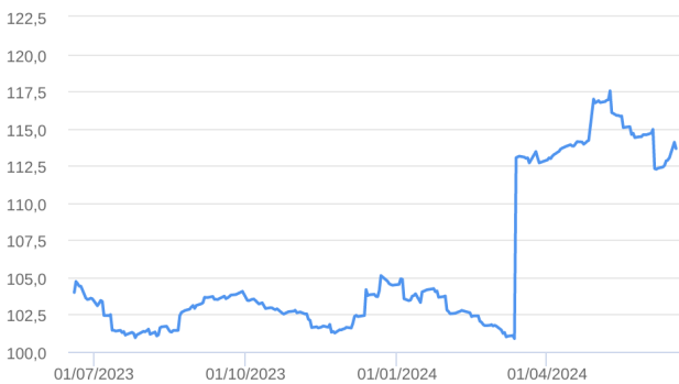
Patrimônio Líquido (R$ Milhões) - 19/06/2023 a 18/06/2024 (diária)