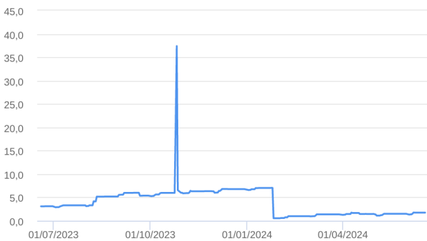
Patrimônio Líquido (R$ Milhões) - 19/06/2023 a 18/06/2024 (diária)