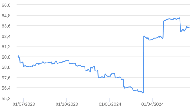
Patrimônio Líquido (R$ Milhões) - 19/06/2023 a 18/06/2024 (diária)