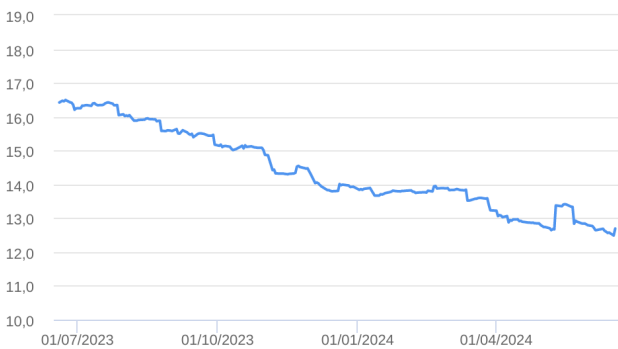
Patrimônio Líquido (R$ Milhões) - 19/06/2023 a 18/06/2024 (diária)