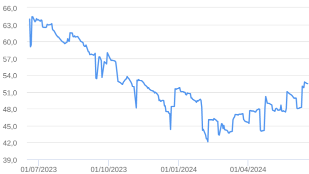
Patrimônio Líquido (R$ Milhões) - 19/06/2023 a 18/06/2024 (diária)