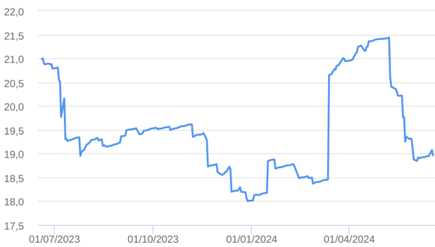
Patrimônio Líquido (R$ Milhões) - 19/06/2023 a 18/06/2024 (diária)