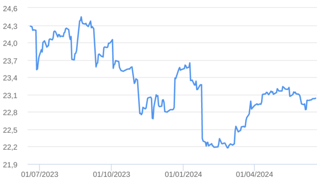
Patrimônio Líquido (R$ Milhões) - 19/06/2023 a 18/06/2024 (diária)