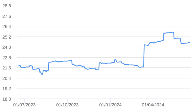
Patrimônio Líquido (R$ Milhões) - 19/06/2023 a 18/06/2024 (diária)