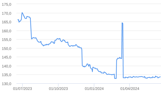
Patrimônio Líquido (R$ Milhões) - 19/06/2023 a 18/06/2024 (diária)