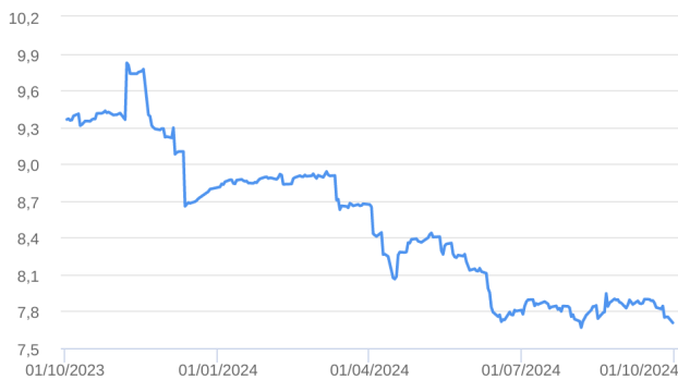
Patrimônio Líquido (R$ Milhões) - 30/09/2023 a 30/09/2024 (diária)