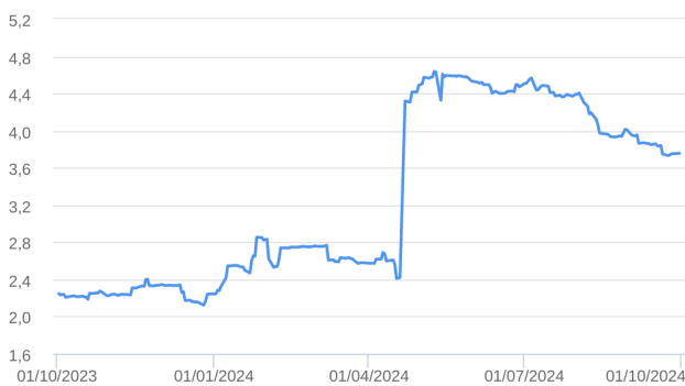
Patrimônio Líquido (R$ Milhões) - 30/09/2023 a 30/09/2024 (diária)