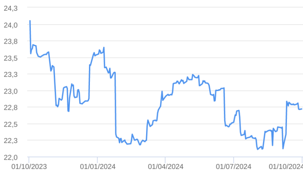
Patrimônio Líquido (R$ Milhões) - 30/09/2023 a 30/09/2024 (diária)