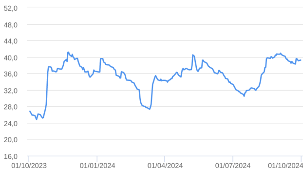
Patrimônio Líquido (R$ Milhões) - 30/09/2023 a 30/09/2024 (diária)