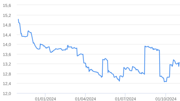
Patrimônio Líquido (R$ Milhões) - 31/10/2023 a 31/10/2024 (diária)