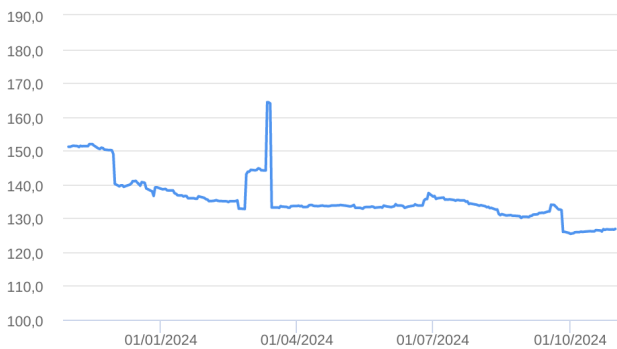
Patrimônio Líquido (R$ Milhões) - 31/10/2023 a 31/10/2024 (diária)