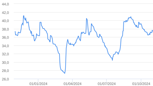
Patrimônio Líquido (R$ Milhões) - 31/10/2023 a 31/10/2024 (diária)