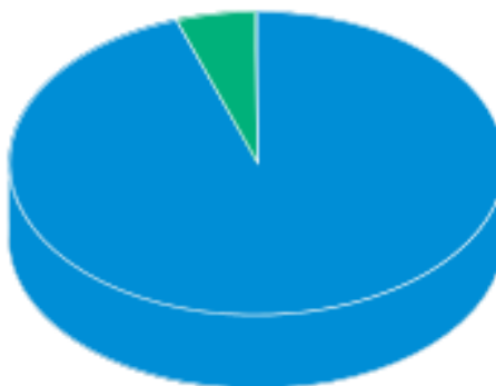
Classe do Ativo