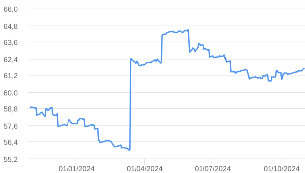
Patrimônio Líquido (R$ Milhões) - 31/10/2023 a 31/10/2024 (diária)