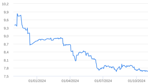
Patrimônio Líquido (R$ Milhões) - 31/10/2023 a 31/10/2024 (diária)