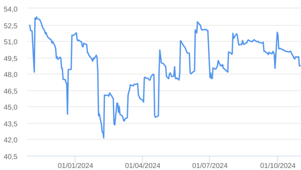
Patrimônio Líquido (R$ Milhões) - 31/10/2023 a 31/10/2024 (diária)