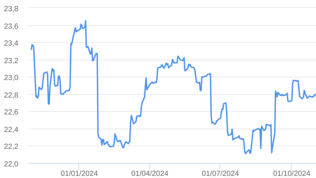
Patrimônio Líquido (R$ Milhões) - 31/10/2023 a 31/10/2024 (diária)