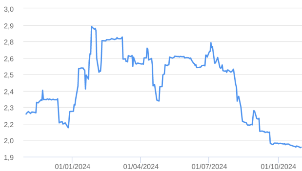
Patrimônio Líquido (R$ Milhões) - 31/10/2023 a 31/10/2024 (diária)